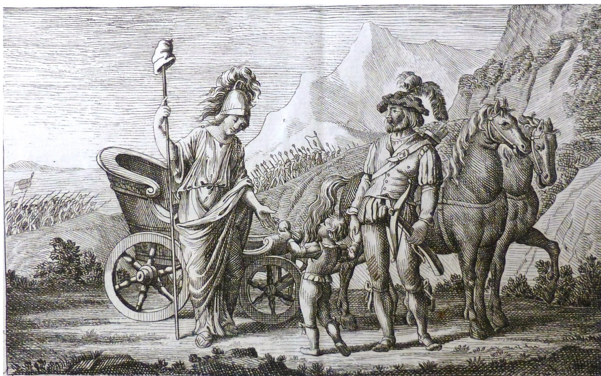
Fig. 2 : « Liberté Égalité, République Française, Armée en Helvétie », en-tête de la lettre du général français Schauenburg adressée au Directoire helvétique au sujet de la comédie à Berne, 19 avril 1799.